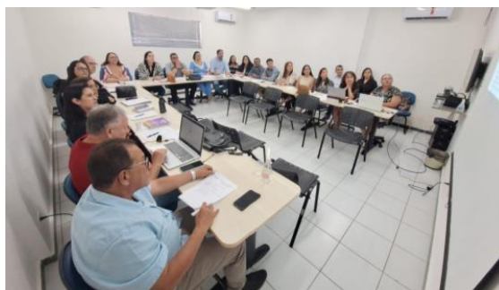
Reunião Diretoria Executiva Ampliada COSEMS-PE 2023

As reuniões da Diretoria Executiva Ampliada tiveram como pautas principais as aprovações do Relatório Anual de Gestão 2022, o Regulamento Interno de Emissão de Passagens, Custeio de Hospedagem, Concessão de Diárias e Despesas, planejamento das atividades para o ano de 2023, aprovações do Plano de Atividades Anual do COSEMS-PE/2024, reuniões Macrorregionais para a Melhoria e Qualificação da Atenção Básica, apreciação do Relatório Individual do Apoiador - RIQ/PE, formação de grupos técnicos, Cirurgias eletivas, Testes rápidos de antígeno SARS-CoV-2, retenção de macas das ambulâncias dos municípios pelos hospitais de gestão estadual, Plano Estadual de Gestão do Trabalho e Educação Permanente, Rede PEBA, cirurgias ortopédicas da III Macrorregião, Maternidade da Microrregião de Abreu e Lima, Rede de Atenção Psicossocial - RAPS e o cuidado em Saúde Mental no território, Projeto de Qualificação e Ampliação da Atenção Primária à Saúde no território de Pernambuco. Entre as atividades retomadas, está a prática de discutir, regularmente, matérias relacionadas aos serviços de Saúde, assim como, atualização constante das representações do COSEMS-PE em outras reuniões e eventos. Destacamos que a pauta planejamento regional integrado (PRI) continua sendo uma das agendas prioritárias.