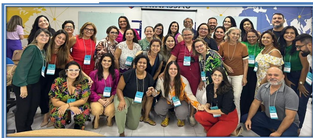
Roda de Conversa Tripartite do PRI, 2023