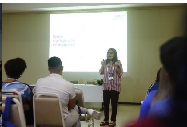
Planejamento estratégico como Ferramenta de Gestão

Por meio de representantes da assessoria jurídica e das secretarias municipais de saúde de São Jose da Coroa Grande, Jaboatão dos Guararapes e Belém de São Francisco, o COSEMS-PE teve sua participação no curso de atualização em Planejamento da Gestão do Trabalho e Educação na Saúde promovido pelo ISC/UFBA e SEGTES/MS e compôs o grupo de elaboração do Plano Estadual de Gestão do Trabalho e educação permanente, período de 2024-2027.