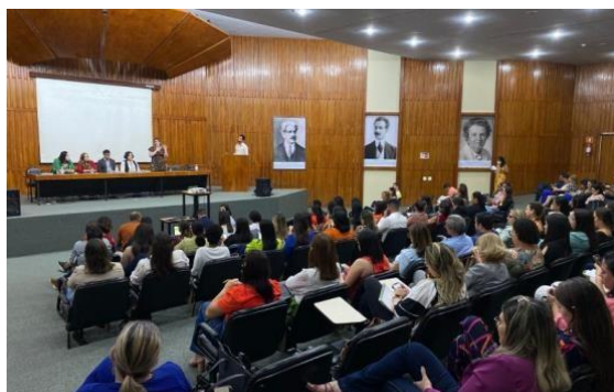
Oficinas para o fortalecimento da Atenção Primária – Petrolina e Recife 2023

O COSEMS-PE realizou seminários com os temas: Planejamento estratégico como Ferramenta de Gestão e, Financiamento: Critério de rateio – a necessidade em cumprir a LC 141, com a participação de convidados do CONASEMS, Ministério da Saúde e Secretaria Estadual de Saúde – SES/PE, para os quais deixamos aqui os nossos agradecimentos.