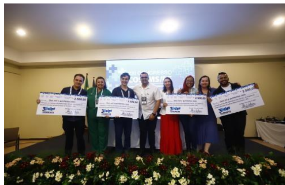
Premiação 5ª Mostra Pernambuco aqui tem SUS