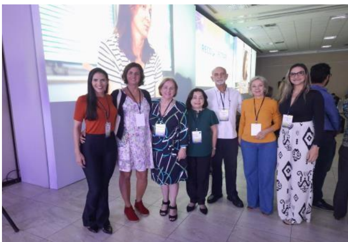
Encontro Nacional da Rede Colaborativa/SP 21 e 22.03.2023

Ainda como agenda extra, o grupo de apoiadoras participou do Iº Seminário de Planejamento, Financiamento e Economia da Saúde em Pernambuco, que aconteceu em Recife no mês de outubro; encerramento da Especialização “Cuida APS” em Brasília em novembro; e visita conjunta SAES/MS – Presidente COSEMS, Secretários de Saúde da IVª Macrorregião e Facilitadora COSEMS-PE em Brasília em novembro.