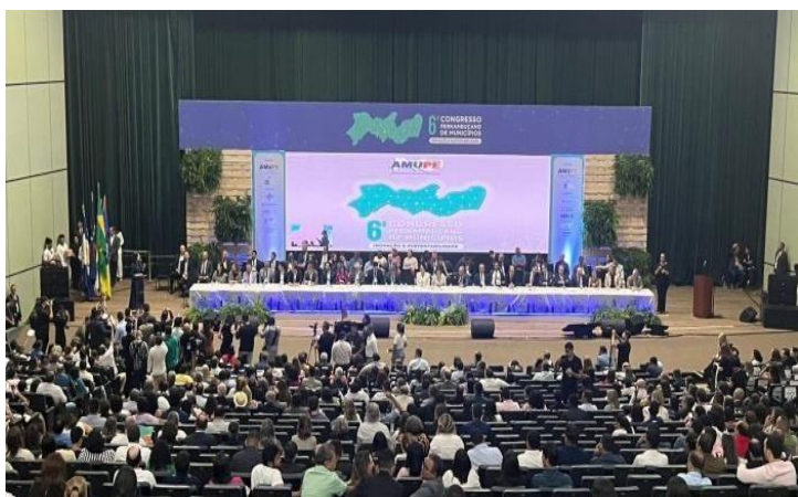
Seminário sobre Saúde Digital, 2023