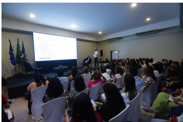
Financiamento: Critério de rateio – a necessidade em cumprir a LC 141

O COSEMS-PE realizou seminários com os temas: Planejamento estratégico como Ferramenta de Gestão e, Financiamento: Critério de rateio – a necessidade em cumprir a LC 141, com a participação de convidados do CONASEMS, Ministério da Saúde e Secretaria Estadual de Saúde – SES/PE, para os quais deixamos aqui os nossos agradecimentos.