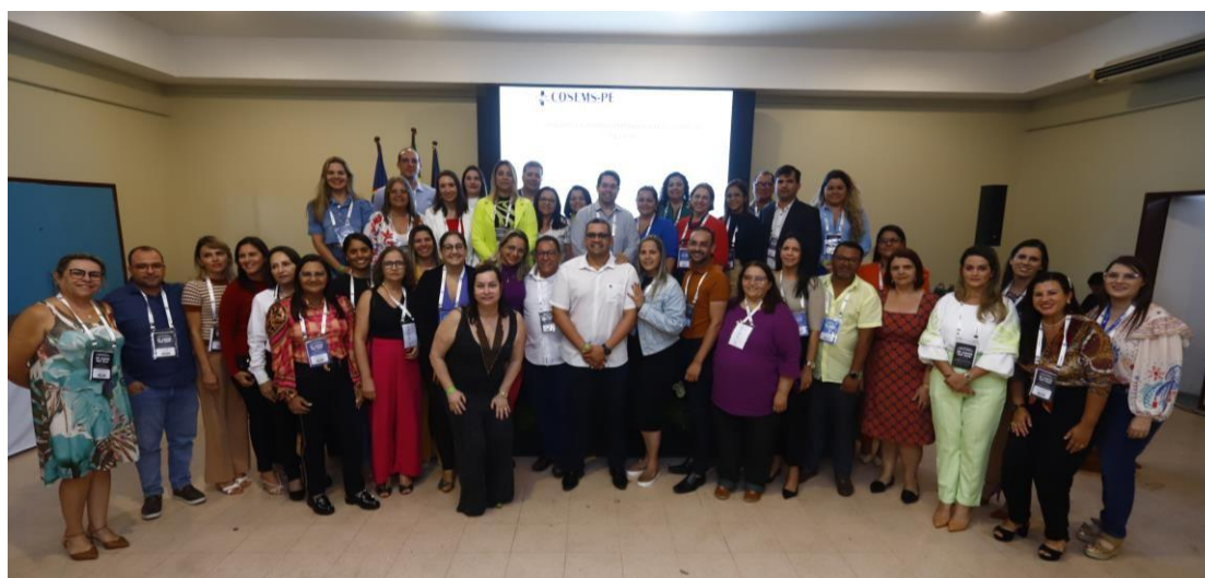
Nova diretoria eleita – COSEMS-PE 2023-2025