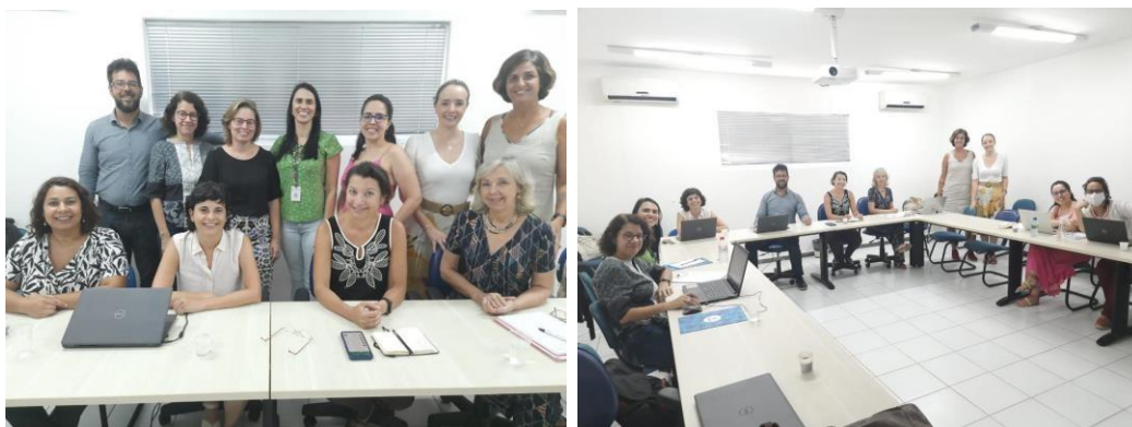
Visita técnica do grupo executivo da Rede Colaborativa, 2023