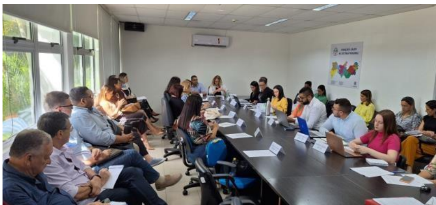
Reunião CIB/PE presencial 2023