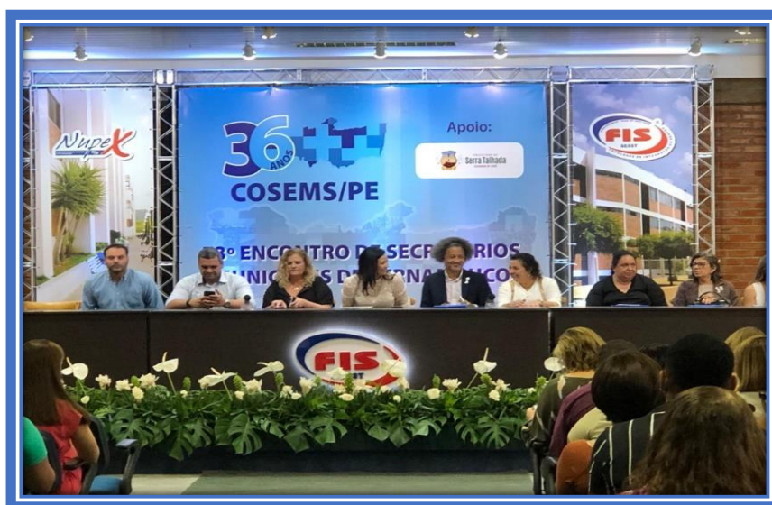
73º Encontro de Secretarias Municipais de Saúde de Pernambuco

No fim do ano o COSEMS-PE realizou o 73º Encontro de Secretarias Municipais de Saúde em Serra Talhada nos dias 30 de novembro e 01 de dezembro. Participaram deste Encontro 194 profissionais, sendo 96 secretários (as) e 98 técnicos (as), onde houve a assembleia com a aprovação da Prestação de Contas do 2º Quadrimestre de 2023, eleição e posse de um membro na representação CIB/PE. Na ocasião foi apresentada a proposta de criação da Medalha Cristina Paulino para a Mostra “PE aqui tem SUS”. A proposta foi aprovada sob aclamação de todos os presentes pelos relevantes trabalhos realizados em vida a favor dos municípios e no COSEMS/PE em defesa do SUS em Pernambuco. Na sequência, foi apresentada e disponibilizada a Nota Informativa nº 02/2023 - COSEMS referente a Portaria nº 960/2023 GM/MS (Saúde Bucal), contendo as recomendações e orientações de que o repasse deve ser feito mediante pagamento de verba temporária ou a título de prêmio.