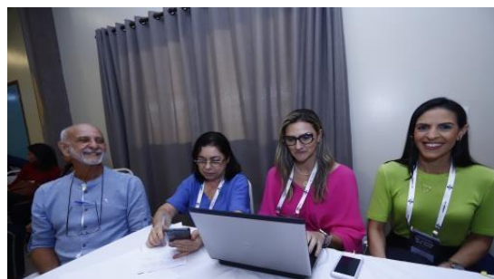
Relatoria no XIII Congresso COSEMS-PE