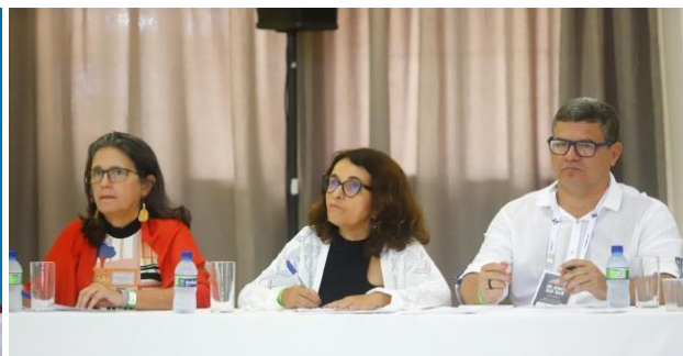
Banca Julgadora 5ª Mostra “Pernambuco aqui tem SUS” – Gravatá 2023

O COSEMS-PE participou do 9º Encontro Norte e Nordeste que foi realizado em Salvador nos dias 04 a 06 de setembro, onde participaram membros da Diretoria e do Núcleo de Assessoria.