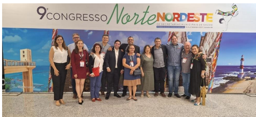
9º Encontro Norte e Nordeste - Salvador 04 a 06 de setembro de 2023

O COSEMS-PE participou do 9º Encontro Norte e Nordeste que foi realizado em Salvador nos dias 04 a 06 de setembro, onde participaram membros da Diretoria e do Núcleo de Assessoria.