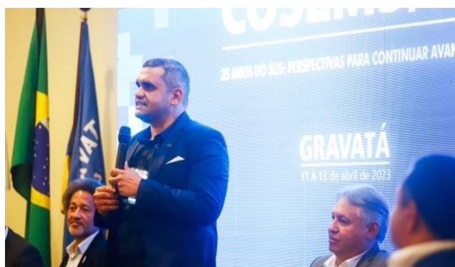
XIII Congresso COSEMS-PE – 2023

Congresso de Secretarias Municipais de Saúde de Pernambuco que aconteceu no período de 11 a 13 de abril de 2023 no Centro de Convenções do Hotel Portal de Gravatá - PE. Na ocasião foi possível contar com a participação de 535 pessoas entre gestores e técnicos. Com o tema “35 anos do SUS: perspectivas para continuar avançando”, sem esquecer que a história deste Conselho se entrelaça com a história do SUS, defendendo o SUS, sendo facilmente perceptível nas relações entre os gestores dentro do COSEMS-PE, além das bandeiras políticas.