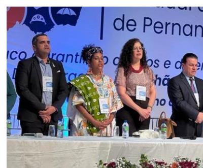
Abertura da Conferência Estadual de Saúde, 2023