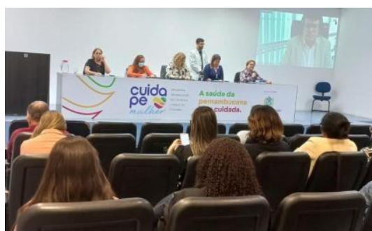
Lançamento do Cuida PE