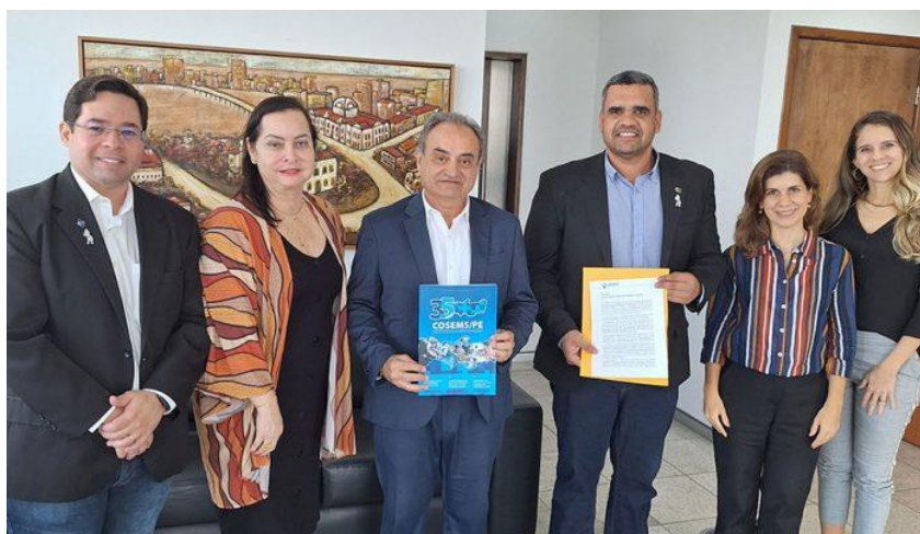
Foto: Visita da diretoria do COSEMS ao presidente do TCE -PE

visita a referida instituição com intuito de apresentar as ações realizadas para o aumento da cobertura como por exemplo o Projeto ImunizaSUS que possibilitou a realização de oficina para apresentar o resultado da Pesquisa Nacional sobre Cobertura Vacinal, seus Múltiplos Determinantes e as Ações de Imunização nos Territórios Municipais pelo Núcleo de Saúde Coletiva/UFMG, assim como para reforçar que as responsabilidades do programa de imunização são das três esferas de governo.